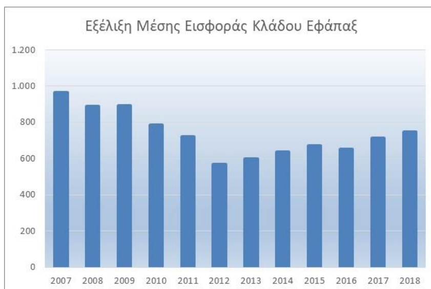
Διάγραμμα 4.1: Εξέλιξη μέσης εισφοράς κλάδου εφάπαξ :

Από τον ανωτέρω πίνακα προκύπτει αύξηση της μέσης ετήσιας εισφοράς κλάδου εφάπαξ για τη χρήση 2018 κατά 5% σε σχέση με την προηγούμενη χρήση. Γενικά, οι εισφορές των ετών 2011-2018 είναι μικρότερες από τις αντίστοιχες των ετών 2007-2010. Φαίνεται όμως να σημειώνεται μία αντιστροφή τάσης.