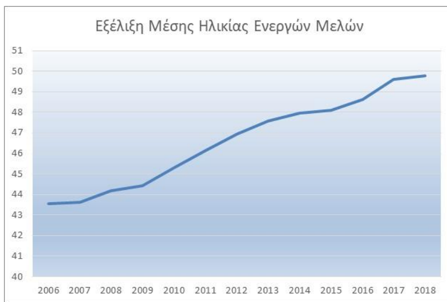
Διάγραμμα 3.3: Διαχρονική εξέλιξη μέσης ηλικίας μελών του Ταμείου